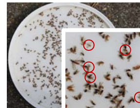
Einfache Bestimmung von ♂