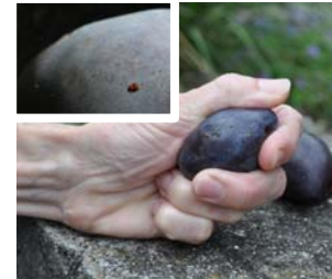
Eiablagen und Saftaustritt bei leichtem Druck