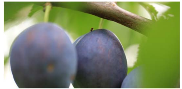
Fliegen sind tagsüber gerne im Schatten

7. Chemische Bekämpfung: Einsatz nur bei nachweislichem Auftreten der KEF in Parzelle oder in der Nähe. Zugelassen sind ausschliesslich die Mittel, welche in der Allgemeinverfügung über die Bewilligung eines Pflanzenschutzmittels in besonderen Fällen für Steinobst gelistet sind. Die Auflagen sind zwingend einzuhalten. Hinweis: Die KEF Strategie ist in Kirschen optimal mit der Kirschenfliegenbekämpfung abzustimmen (Nebenwirkung auf KEF). Bei Fängen in Überwachungsfallen oder bei Fruchtschäden: gezielte Behandlungen gegen KEF kulturspezifisch einplanen.