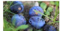
Tropfende Früchte und Fallobst als Brutstätten für KEF