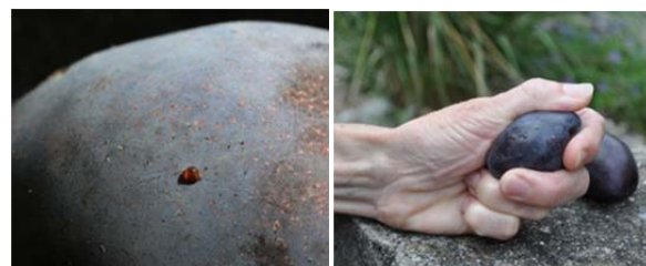
Eiablagen auf Zwetschge und Saftaustritt bei leichtem Druck