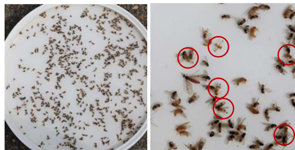
Einfache Bestimmung von Männchen