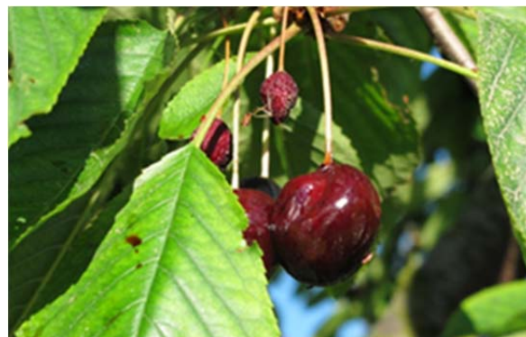
Hängengebliebene Kirschen sind Brutstätten

8. Unternutzen/Mehrfachrückstände: Einige Pflanzenschutzmittel (siehe Allgemeinverfügung und PSMV) haben Auflagen gegenüber von Gewässern, Verfütterung bei Vieh und sind bienengiftig. Die Einhaltung der Auflagen der Mehrfachrückstände kann nicht garantiert werden.