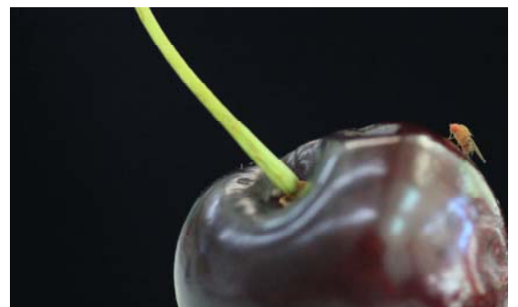
Weibchen auf Kirsche

2. Befallskontrolle: Regelmässige Befallskontrollen von mind. 50 Früchten pro Schlag helfen beim frühzeitigen erkennen des Befalls, so dass Ernte- und Pflanzenschutzmanagement sofort angepasst, die Hygienemassnahmen intensiviert und der Erntetermin vorgezogen werden kann. Befallsproben auf Eiablagen und Einstichlöcher kontrollieren und/oder 2h in lauwarmes Salzwasser geben und danach auf Maden kontrollieren.