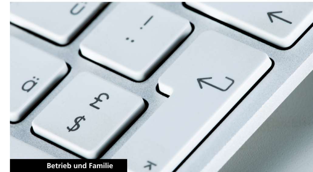
Betrieb und Familie